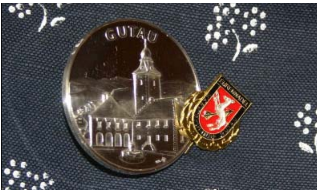
Ehrenzeichen wie Großer Gutauer Taler in Silber und Ehrennadel in Gold werden verliehen.

Freitag, 29. Jänner 2010, 20.00 Uhr, Pfarrsaal Ein bunter Abend bietet Unterhaltung vom Feinsten: